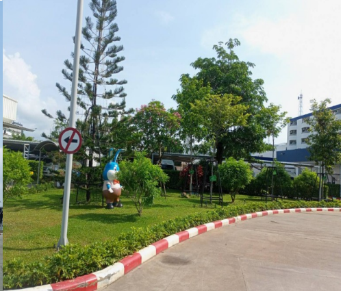
พื้นที่สีเขียว