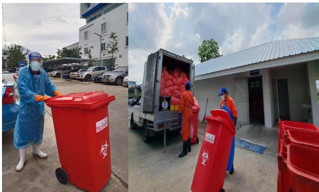
การขนส่งขยะติดเชื้อ