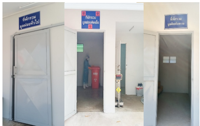
ห้องพักขยะ