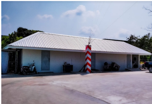
โรงพักขยะ