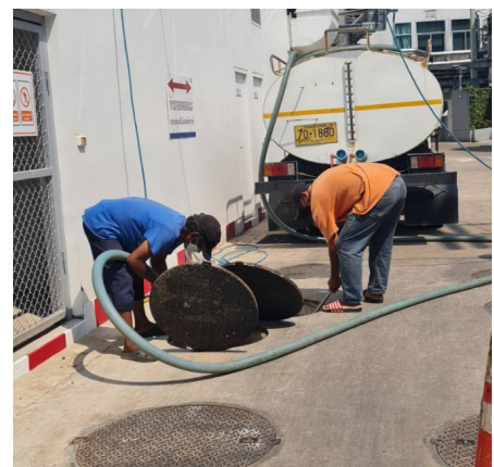
สูบลากตะกอนจากระบบบำบัดน้ำเสีย