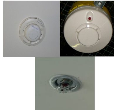
เครื่องตรวจจับควัน / ความร้อน และหัวกระจายน้ำดับเพลิง