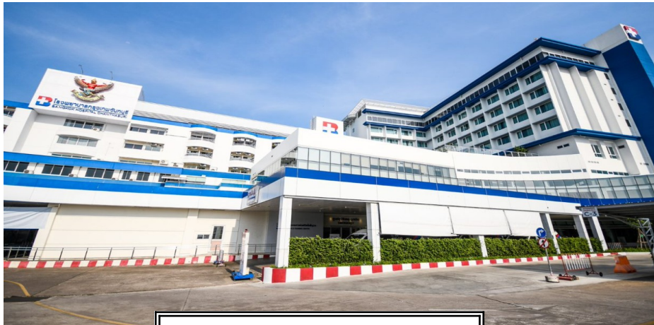
อาคารโรงพยาบาลกรุงเทพจันทบุรี