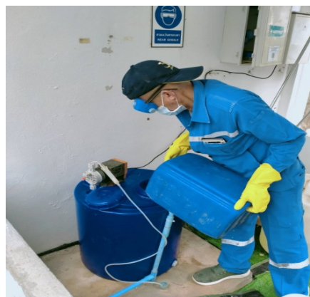
ระบบฆ่าเชื้อด้วยคลอรีนในน้ำทิ้งสุดท้าย