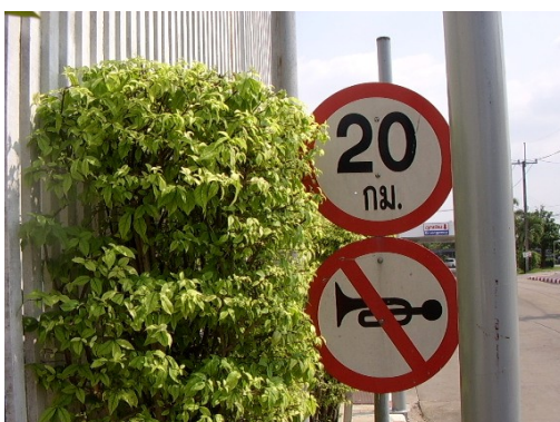
ป้ายจำกัดความเร็วภายในโรงพยาบาล