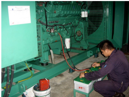
MN เครื่องกำเนิดไฟฟ้าสำรอง