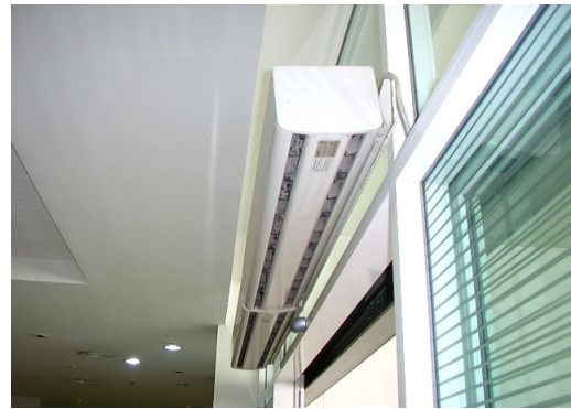
ม่านตัดอากาศ