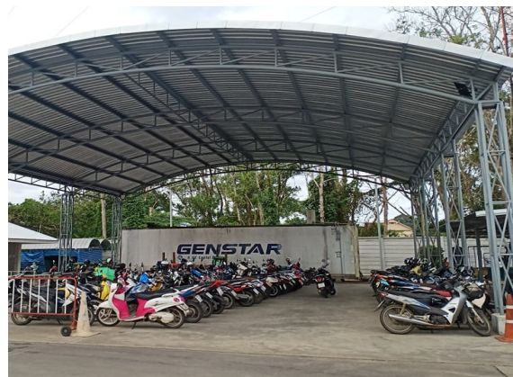
ลานจอดรถจักรยานยนต์