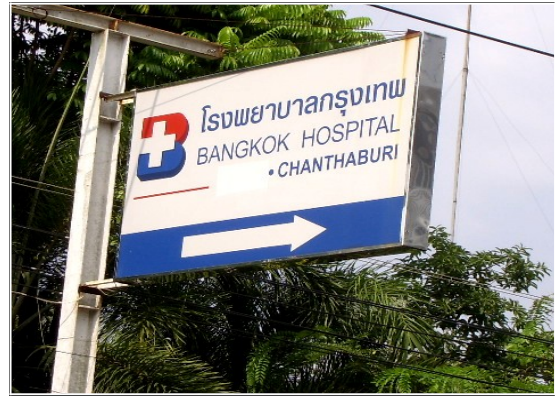
ป้ายทางเข้าโรงพยาบาล