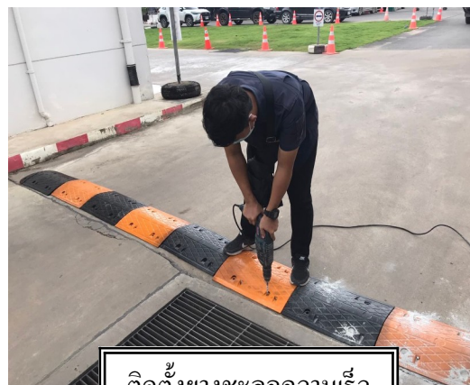
ติดตั้งยางชะลอความเร็ว