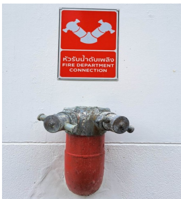
หัวรับน้ำดับเพลิง