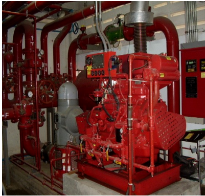
เครื่องสูบน้ำดับเพลิง