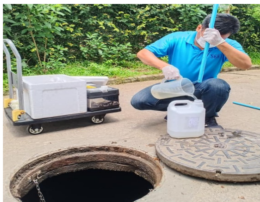
เก็บวิเคราะห์ตัวอย่างน้ำ