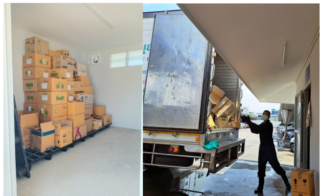
การขนส่งขยะอันตราย