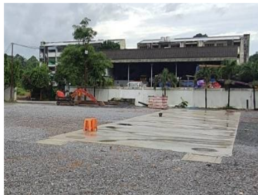
บ่อหนองน้ำ