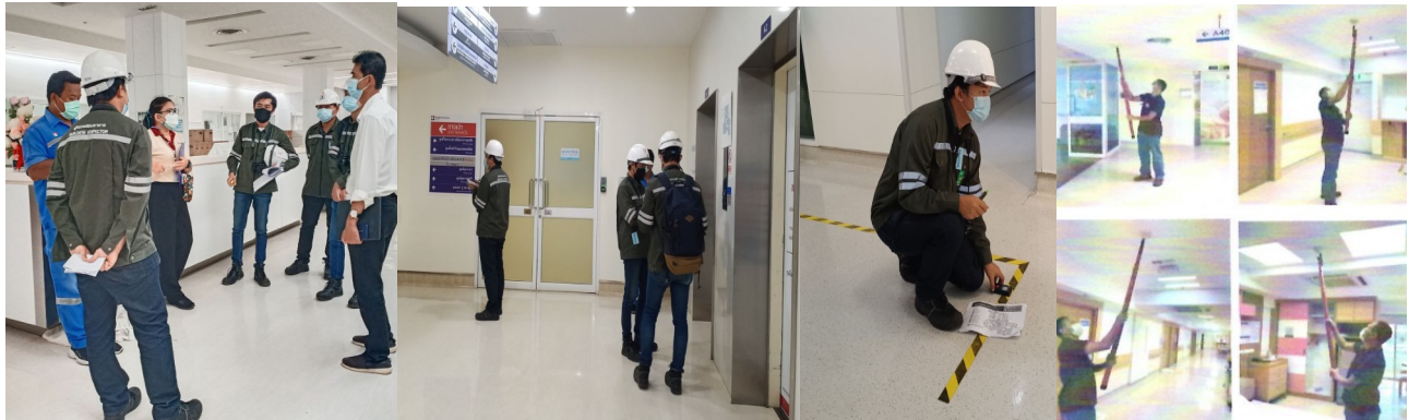
ตรวจสอบป้ายทางหนีไฟ / บำรุงรักษาอุปกรณ์-สัญญาณแจ้งเหตุเพลิงไหม้