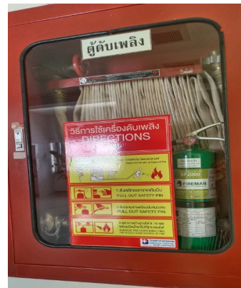
ตู้เก็บสายน้ำดับเพลิง