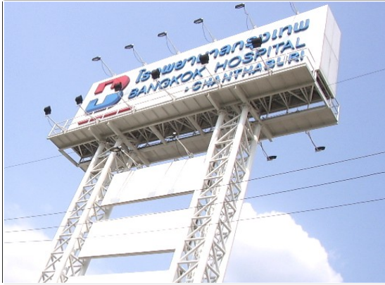
ป้ายโรงพยาบาล