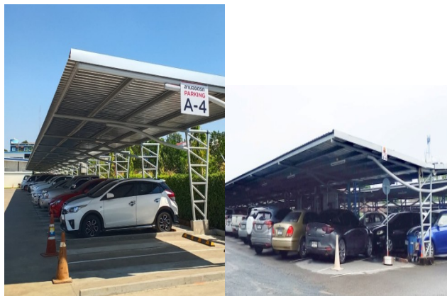
ลานจอดรถยนต์