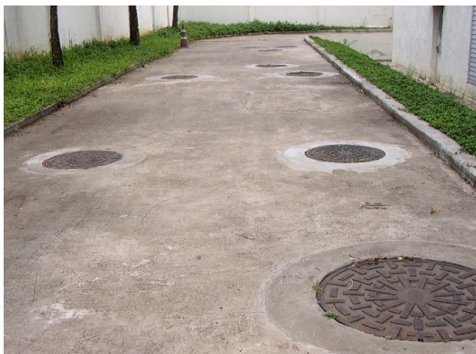
บ่อน้ำบาดน้ำเสีย