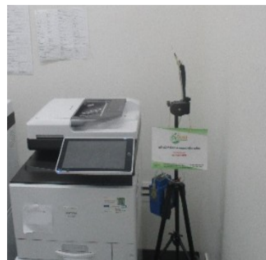
ตรวจวัดคุณภาพสิ่งแวดล้อมประจำปี